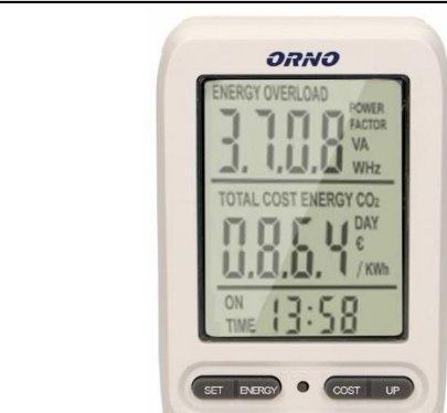
Rys. 1/ Fig. 1/ Add. 1/ Fig. 1/ Рис.1